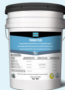
Fiche technique DS-65437