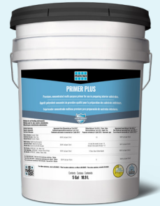
Data Sheet 65437