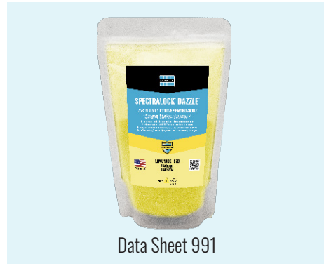
Data Sheet 991

SPECTRALOCK ® DAZZLE ™ produces stunning grout design combinations when used with metallic, glass, porcelain, or any other type of tile and stone.