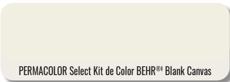
PERMACOLOR Select Kit de Color BEHR® Blank Canvas

Con PERMACOLOR® Select AnyColor™, puede ofrecer a sus clientes estos colores de la edición especial 2023 inspirados en los principales expertos en pintura y color del mundo.