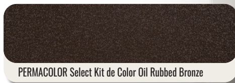
PERMACOLOR Select Kit de Color Oil Rubbed Bronze