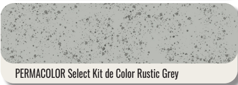
PERMACOLOR Select Kit de Color Rustic Grey