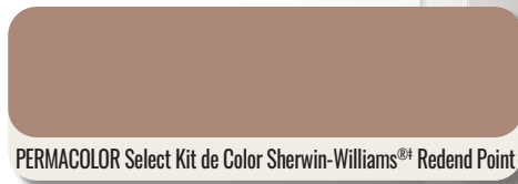
PERMACOLOR Select Kit de Color Sherwin-Williams® Redend Point