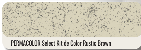
PERMACOLOR Select Kit de Color Rustic Brown